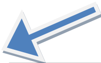
終点・熊野本宮大社