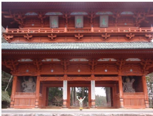
熊野古道・小辺路のスタート 高野山大門