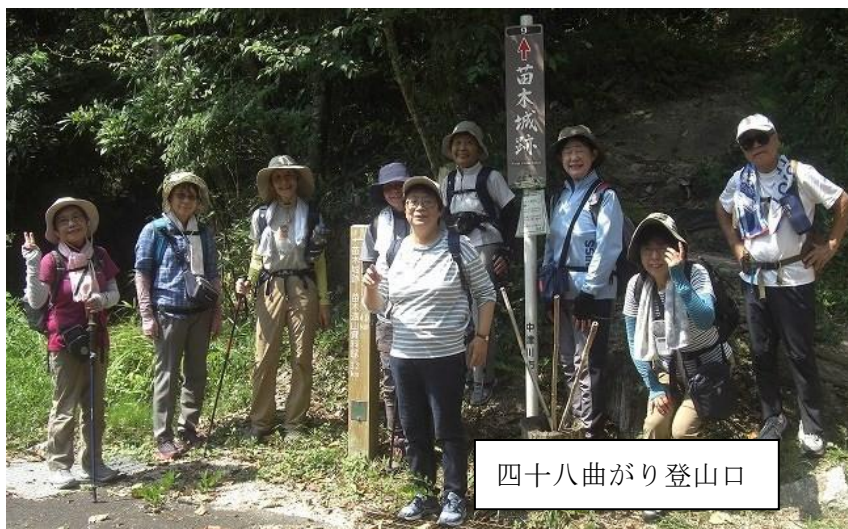
四十八曲がり登山口