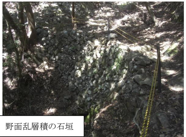
野面乱層積の石垣